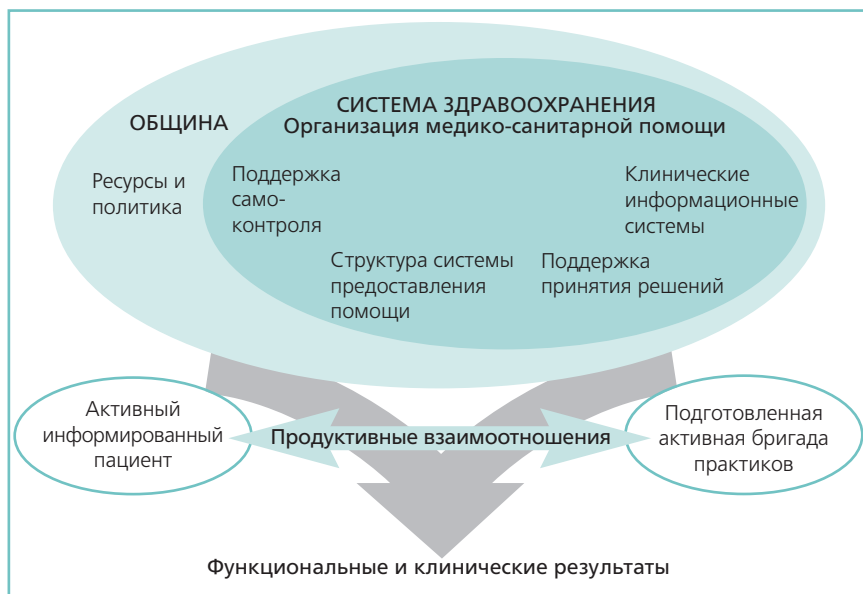
Рис. 3. Модель помощи при хронических заболеваниях

Подходы, ориентированные на систему предоставления услуг, были опробованы на национальном уровне, а также местными и региональными объединениями, действующими в рамках учреждения или страховой программы или программы льгот (вставка 2). Например, в Германии врачи сначала возражали против оказания помощи при хронических болезнях в рамках, определяемых рекомендациями, основанными на фактических данных и обмене информацией, однако в настоящее время осуществляются подобные программы в отношении конкретных заболеваний (26). Было принято законодательство по стимулированию поставщиков услуг разрабатывать подходы к предоставлению скоординированной помощи людям с длительными хроническими состояниями, и исследуются новые механизмы стимулирования, скорректированные по степени риска (27).