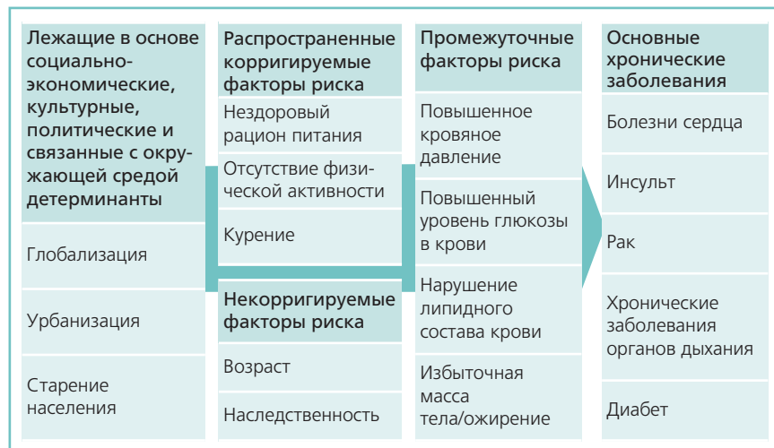
Рис. 1. Ведущие причины хронических болезней по данным ВОЗ