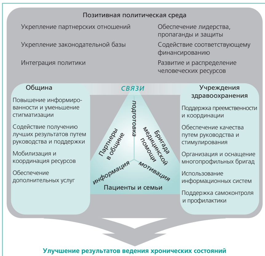
Рис. 4. Структура новаторских методов оказания помощи при хронических состояниях